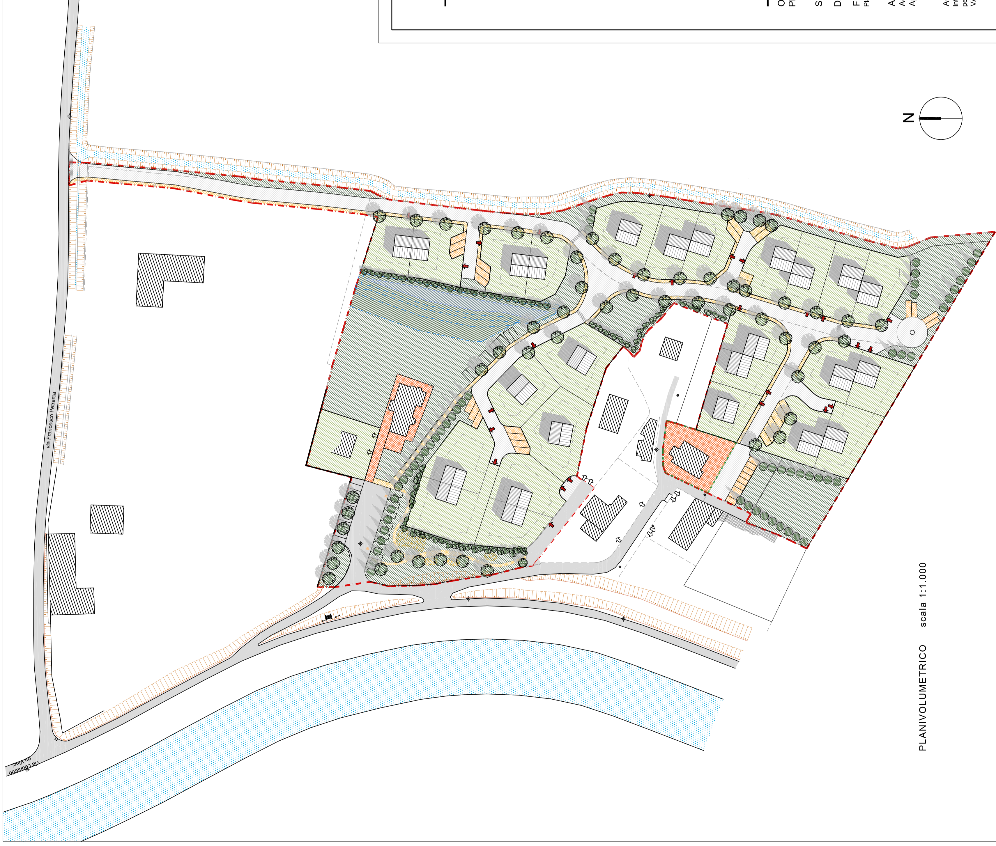
PLANIVOLUMETRICO scala 1:1.000